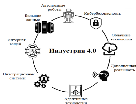
Рис. 1. Компоненты Индустрии 4.0

Спрос на эти навыки и квалификацию, несомненно, будет выше, чем в настоящее время. Это приведет к необходимости изменения и адаптации существующих учебных программ и инструментов, используемых в образовательной системе, для создания нового формата учебного плана, который вооружит студентов необходимыми навыками для трудоустройства.