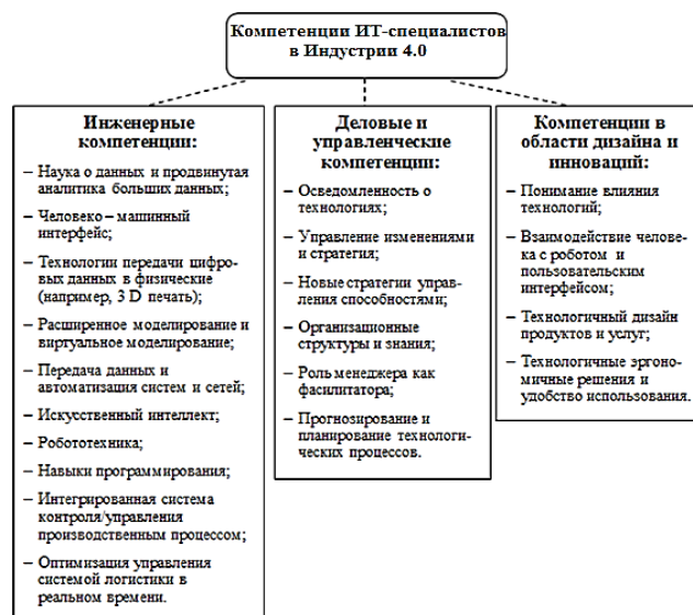
Рис. 3. Обобщенная структура компетенций ИТ-специалистов в эпоху Индустрии 4.0

Более детально компетенции ИТ-специалистов представлены на рис. 3 [19].